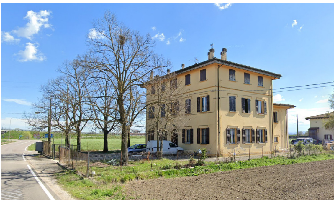
Prospetto ovest – Immagine da Google Maps