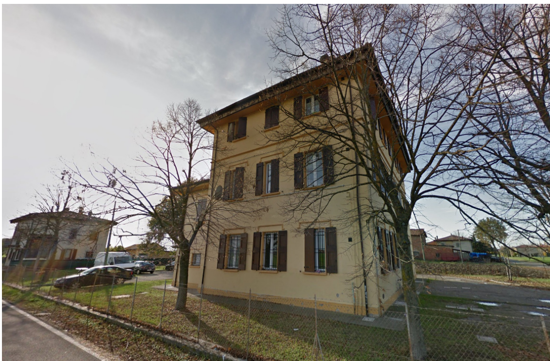
Prospetto ovest