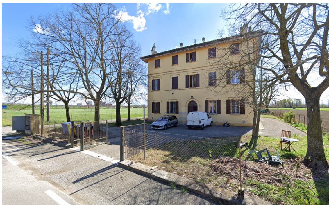
Prospetto nord – Immagine da Google Maps

Tutti gli appartamenti giacciono in cattivo stato di conservazione , con elementi architettonici più o meno danneggiati a seconda della data di ultima revisione/riparazione.